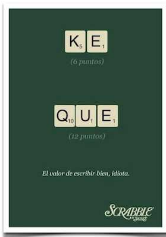
Anunciant: Scrabble Mèxic. Dissenyador: Eduardo Salles. 2010.